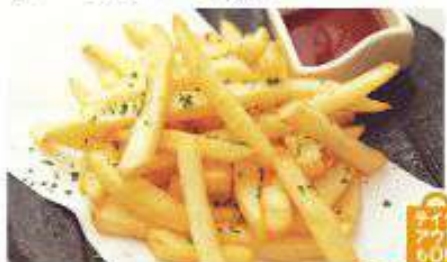
ポテトフライ 480円 (税込)