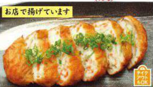
特製さつま揚げ 620円 (税込)