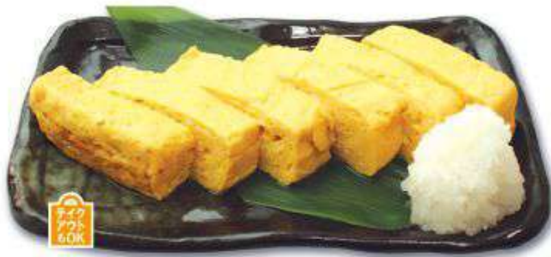
手作り だし巻き玉子 590円(税込)