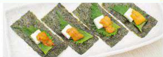
ウニとクリームチーズの海苔巻き