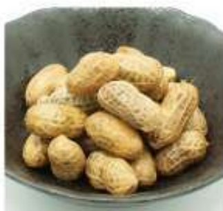
ゆで落花生 490円(税込)