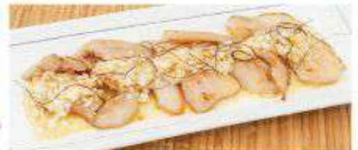
豚トロ ねぎ塩焼き 580円(税込)