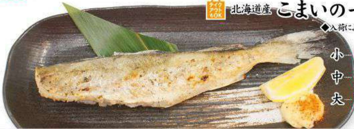
小 530円(税込) 中 580円(税込) 大 630円(税込)