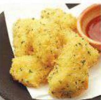
カマンベールチーズフライ 590円 (税込)