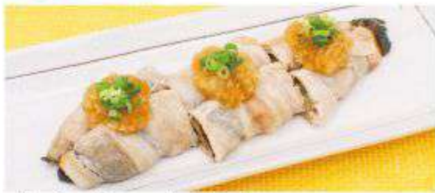
長なすの肉巻き 650円(税込)