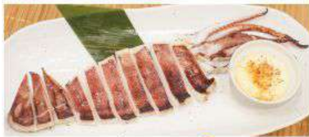
イカの一晩干し 780円(税込)