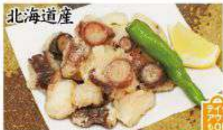
北海道産 北海タコのおつまみから揚げ 650円 (税込)