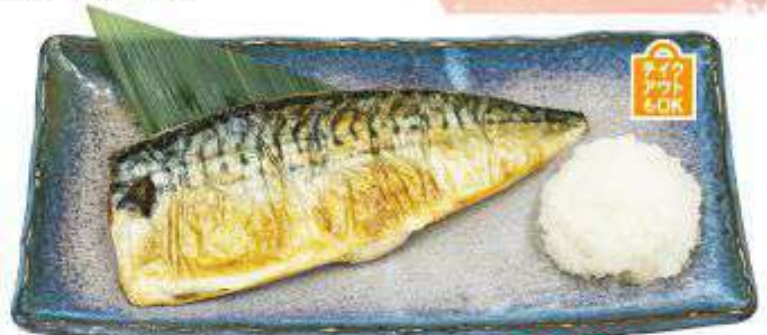
サバの塩焼き うまみ昆布仕込み 790円(税込)