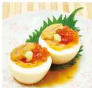
ウニクラのせ玉子 550円(税込)