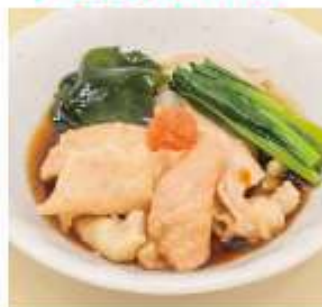
とり皮ポン酢 490円(税込)