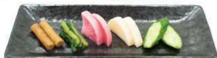
漬物盛り合わせ 490円(税込)