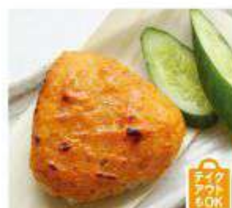
ウニ味噌焼きおにぎり