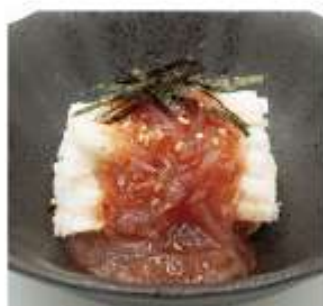
山芋の梅水晶がけ 490円(税込)