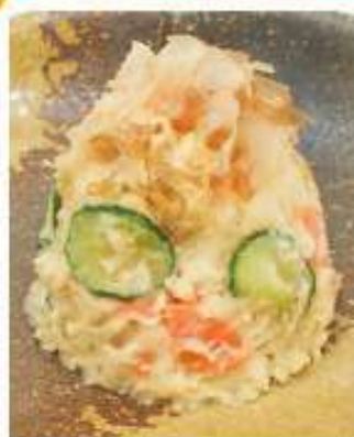
和風ポテトサラダ 520円(税込)