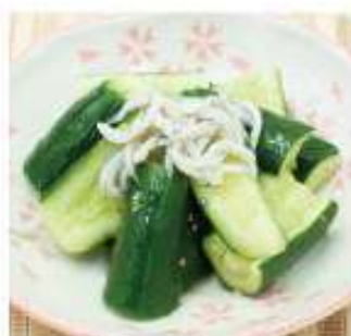
たたききゅうり 490円(税込)