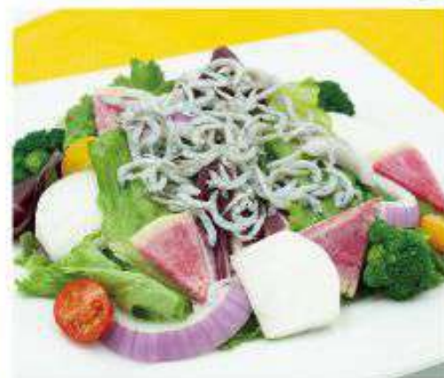
しらすと 新鮮野菜の サラダ