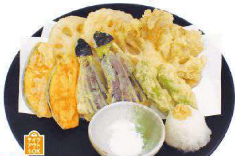
魚介と旬野菜の天ぷら盛り合わせ 魚介類3種、旬野菜3種 1,280円 (税込)