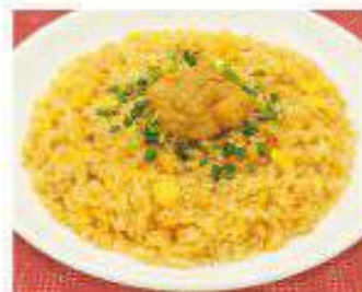
黄金の ウニチャーハン