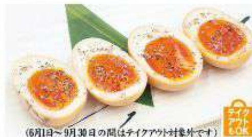
半熟玉子のトロトロ天ぷら 1個 190円(税込)