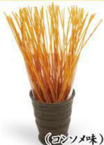
(ヨソメ味) おつまみ 揚げパスタ 390円(税込)